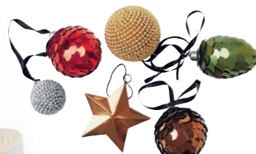
okrašeno drevo Novoletni okraski H & M. Cena: 3,99 evra za okrasek. www.hm.com