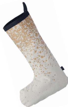
pod kaminom Praznična nogavica fermLIVING. Cena: 27 evrov. www.fermliving.com