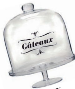
steklena Doza za sladico Butlers. Cena: 50,76 evra. www.butlers-online.co.uk