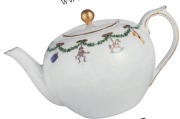
kraljevsko Čajnik Royal Copenhagen. Cena: 99 evrov. www.royalcopenhagen.com