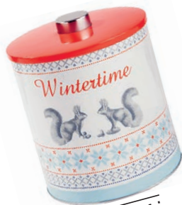
diši po peki Praznična doza za kekse, Butlers. Cena: 6,35 evra. www.butlers-online.co.uk