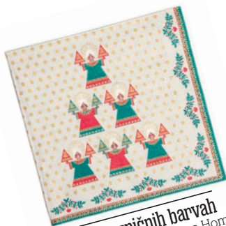
v prazničnih barvah Slavnostni serviet, Zara Home. Cena: 3,78 evra. www.zarahome.com