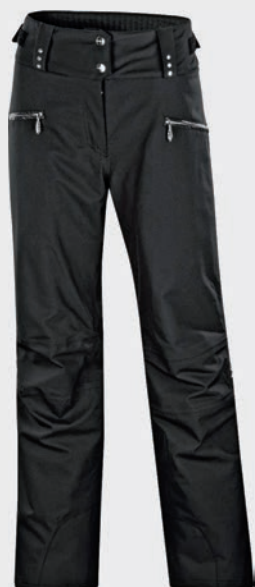
ETIREL Ženske smučarske hlače Krystal