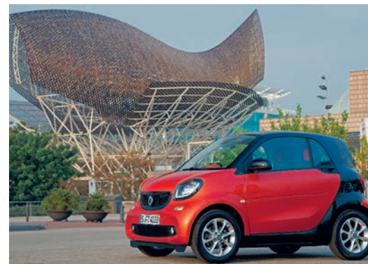
Smart pred skulpturo znanega arhitekta Franka O. Gehryja.

V osnovi staro ribiško mesto Sitges , od Barcelone oddaljeno le dobrih 35 kilometrov, obkroža kar enajst peščenih plaž in nekaj manjših krajev, ki ponujajo celo paleto možnosti za navtične aktivnosti. Vožnja od Barcelone proti Sitgesu poteka po eni najbolj romantičnih cest, ob kateri se odpirajo raznovrstni razgledi na izjemno obmorsko pokrajino. Sitges je posebej znan po svojem nočnem življenju