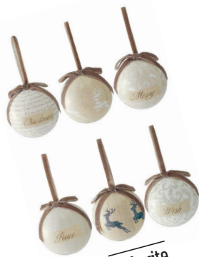
čudovite Okrasne bunkice Next. Cena: 10,18 evra za komplet šestih. www.next.co.uk