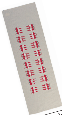
Božičkov ples Tekoč za mizo Almedahls. Cena: 24,37 evra. huset-shop.com