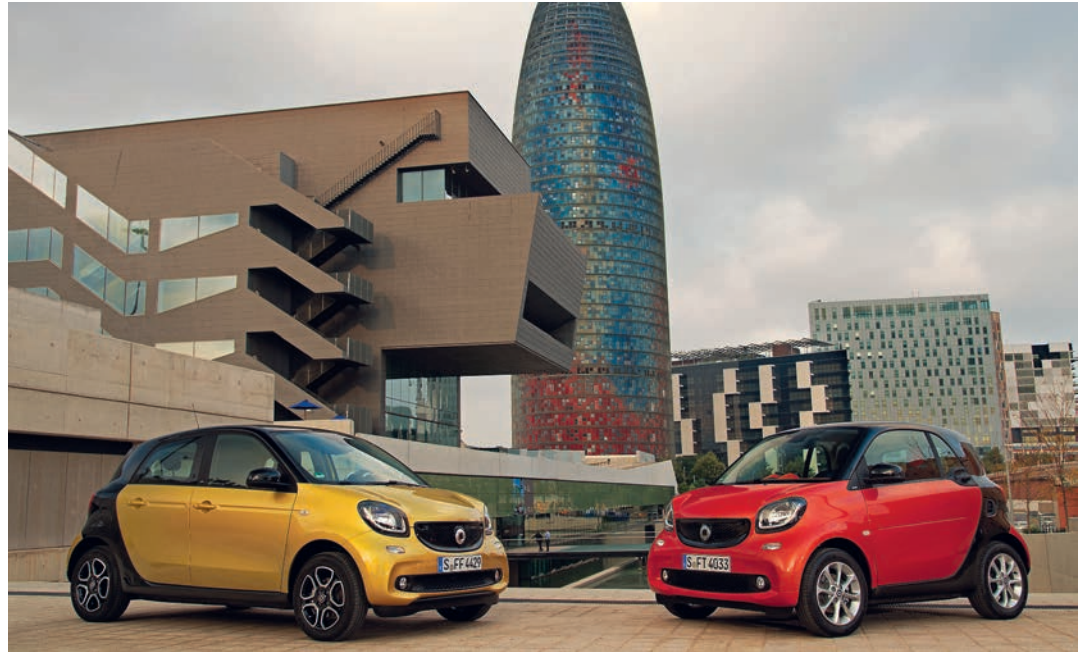
Smart fortwo in forfour, v ozadju nebotičnik Torre Agbar, ki je delo francoskega arhitekta Jeana Nouvela.

in številnih festivalih, ki se odvijajo skozi celotno leto. Tu je doma tudi ena najboljših mediteranskih kuhinj, pri kateri izstopa lokalno tipična jed Xato , vsekakor vredna naše kulinarčne pozornosti. Posebej zanimiva urbana postojanka je Fosbury Cafe v neposredni bližini Sitgesa v manjšem kraju Castelldefels . Tu nam bodo ponudili odlično kuhinjo, ki jo kombinirajo z modernimi okusi in tehnikami priprave na samosvoj način.