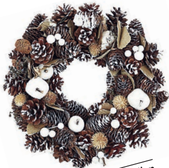
s snegom pobeljen Božični venec. Cena: 25,38 evra. www.harrods.com

Prižgane dekorativne sveče, adventni venec na vratih ali mizi, praznični okraski, ki se vijejo po drevescu, ter čarobna osvetlitev prostora bodo cel mesec risali čudovite praznične podobe.