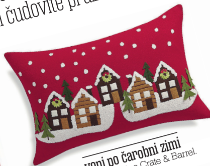
vonj po čarobni zimi Okrasna blazina Crate & Barrel. Cena: 60,24 evra. www.crateandbarrel.com