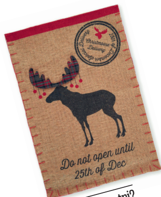
kaj bo notri? Darilna vrečka Next. Cena: 24,37 evra. www.next.co.uk