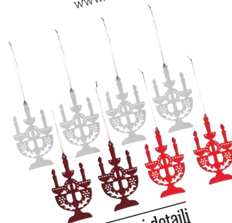
pisani detajli Okraski Ikea. Cena: 3,99 evra za 4 kose. www.ikea.com