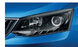
Samodejni vklop dolgih svetilk

Kombinirana poraba goriva in izpusti CO 2 : 3,4-4,8 l/100 km in 88-110 g/km, emisijska stopnja: EURO 6, specifična emisija dušikovih oksidov (NO x ): 0,0115-0,0538x10 11 g/km, trdi delci: 0,00-0,00023 g/km, število delcev: 0,02-7,50. Ogljikov dioksid (CO 2 ) je najpomembnejši toplogredni plin, ki povzroča globalno segrevanje. Emisije onesnaževal zunanega zraka iz prometa pomembno prispevajo k poslabšanju kakovosti zunanega zraka. Prispevajo zlasti k čezmerno povišanim koncentracijam prizemnega ozona, delcev PM 10 in PM 2,5 ter dušikovih oksidov.