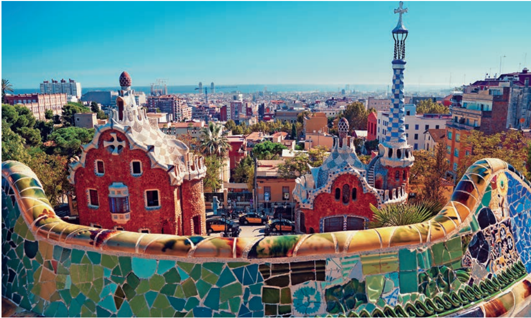
Pogled na Gaudijev pravljnični park Güell.