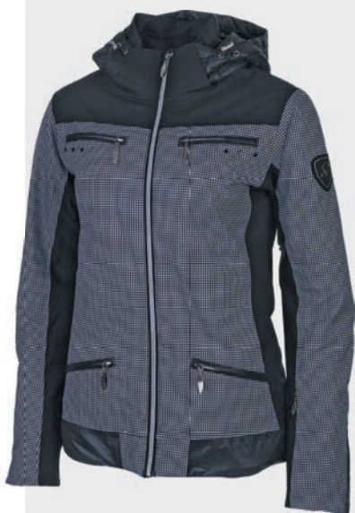
ETIREL Ženska smučarska jakna Kaitlyn

V prodajalnah INTERSPORT je doma zimska smučarska kolekcija Safine. Smučarska oprema in oblačila Safine so oblikovana z mislijo na ženske in za ženske. Atraktiven dizajn in vsestranska uporabnost za odlično smučarsko izkušnjo.