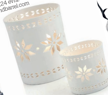
svetlobni odsev Svečnik, Crate & Barrel. Cena: od 4,26 do 11,15 evra. www.crateandbarrel.com