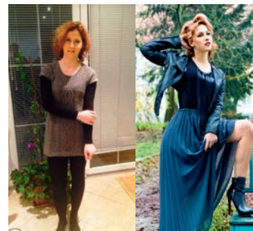
Postani model za en dan