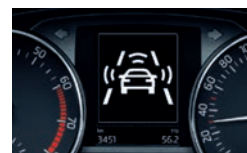
Funkcija zaviranja v sili