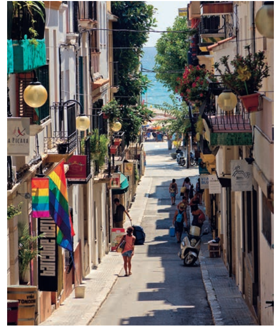
Pisane ulice romantičnega obmorskega mesta Sitges.