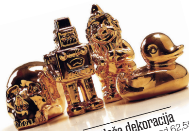
svetleča dekoracija Serija Goldies, Seletti. Cena: od 62,55 evra. www.urbanspaceinteriors.com