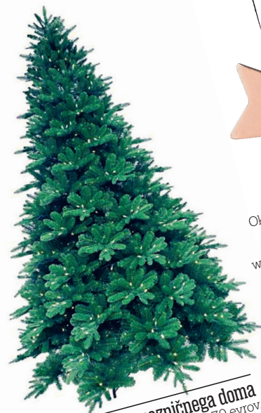
ognjišče prazničnega doma Umetna smreka. Cena: 170 evrov. www.homedepot.com