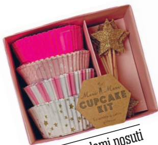
z zvezdami posuti Papirčki za mizne. Cena: 9,80 evra. popolna-dekoracija.si