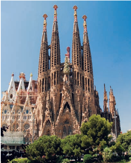
Sagrada Família je zasnoval španski arhitekt Antoni Gaudí.