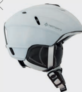
TECNOpro Smučarska čelada Brave