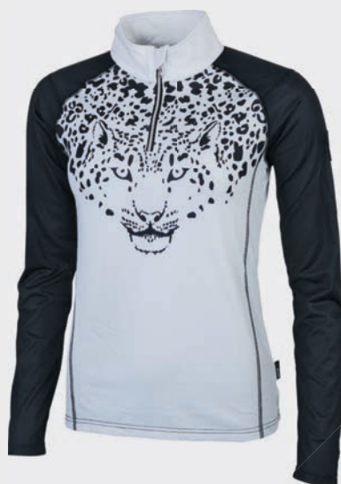
ETIREL Ženski smučarski puli Karmelle